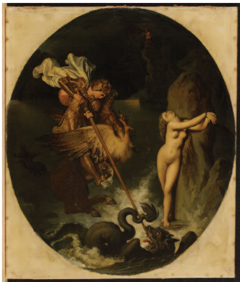
Jean-Auguste Dominique Ingres, Roger délivrant Angélique, © musée Ingres, Montauban