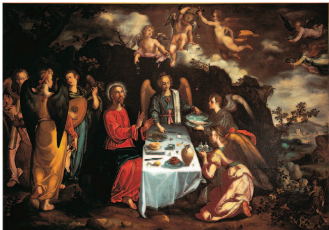
Francisco Pacheco, Le Christ servi par les anges dans le désert , h/t, 1616