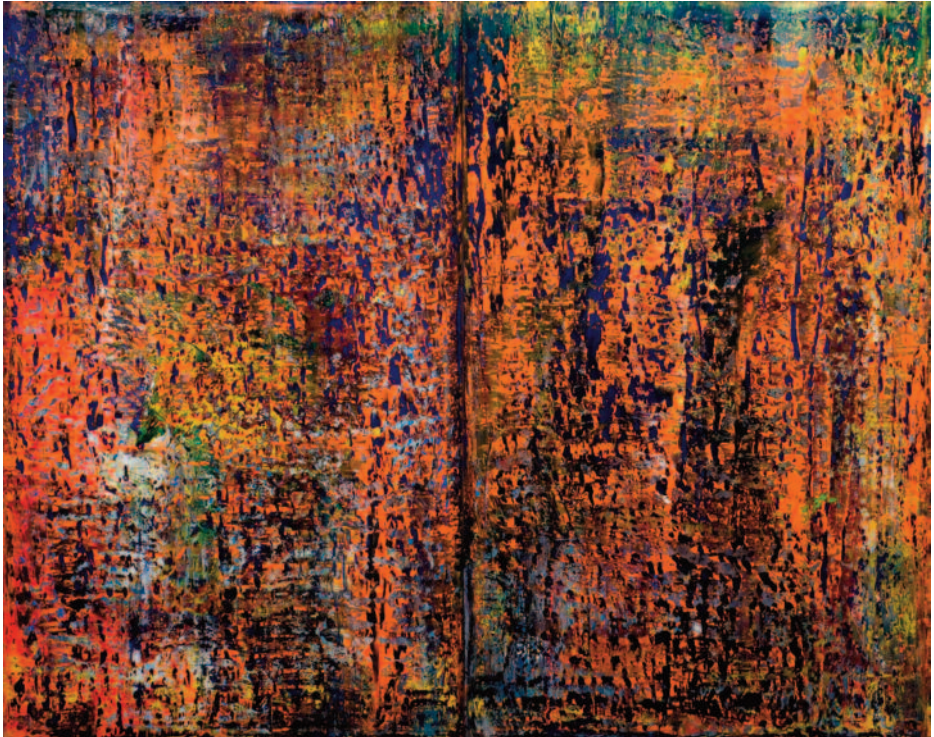
Abstraktes Bild , 1989, h/t, 320 x 400 x 4,5 cm, © Gerhard Richter