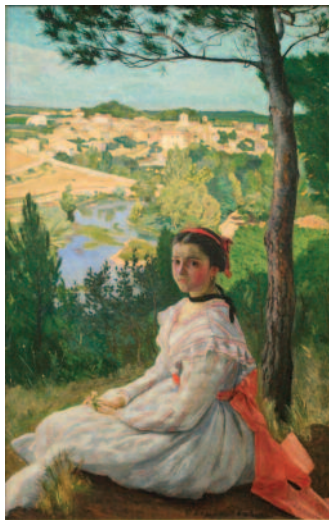
Frédéric Bazille, h/t, Vue de village , Musée Fabre de Montpellier Méditerranée Métropole