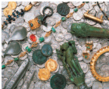
Le Trésor d'Éauze, © Conservation départementale du Patrimoine et des Musées/Photo D.Martin