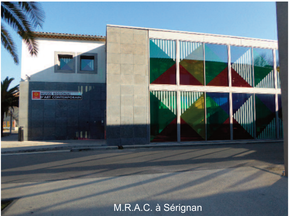
M.R.A.C. à Sérignan

Les Amis des musées d'Occitanie, actuellement forts de plus de 7000 adhérents, partagent des valeurs communes et interviennent comme “passeurs de culture” sous l’égide de la Fédération Française des Sociétés d'Amis de Musées (FFSAM). Ils agissent dans leurs musées pour les valoriser, enrichir leurs collections et les faire connaître auprès de tous les publics.